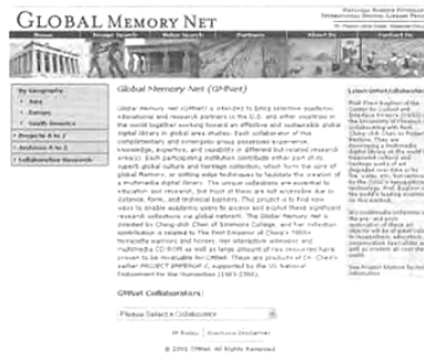
図2 暫定的なGMNetホームページ

イブラリープロジェクト間の共同展開を促進し、 unnecessary準備あるいは運用上の後れや硬直性から研究・開発活動を自由にできる。世界には200以上の国があり、デジタルコレクションの発展、デジタルパートナーシップ、そして共同研究活動には限りない機会が存在するといえよう。中国の素焼きの武人と馬など、始皇帝について作成した中心的なイメージコレクションのほかには現在では多くのトピックに関するリストが加わった。それらには、次のようなものが含まれている。このリスト