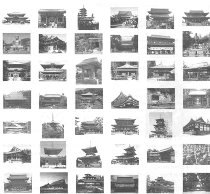
図13 日本の寺院と宗教的な場所

指針を表明することは行うより易しい。道筋に多くの障害が存在し、実現が難しい指針への接近には多くのプロセスが必要である。共有(sharing)やアクセス(accessing)の視点から、最初から我々は多くの高品質のデジタルコンテンツを持ち、だれもすべてを所有できるわけではないので、コンテンツの作成は国際的な共同に頼らなければならない。さらに、これらのコンテンツを統合的に提供する技術と、それらのコンテンツを提供・アクセス・検索できるインフラストラクチャを持たなければならない (2), (3), (4) 。それは、Global Memory Netが特にコンテンツの作成と手段の開発の領域に影響を与えてきたところである。新たな共同や研究・開発活動が我々の研究領域で拡大しており、いつでもアクセスできるデジタルコレクションを作成したり、マルチメディアコンテンツでのメタデータの標準化・相互運用性・システムの拡張性・検索性、さらに知識の創造のためにこれらの情報源を利用可能とすることについて、実際の研究・開発計画を熟考するためのデジタルライブラリーのコミュニティを形成