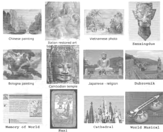
図3 Global Memory Netのいくつかのトピックス

イブラリープロジェクト間の共同展開を促進し、 unnecessary準備あるいは運用上の後れや硬直性から研究・開発活動を自由にできる。世界には200以上の国があり、デジタルコレクションの発展、デジタルパートナーシップ、そして共同研究活動には限りない機会が存在するといえよう。中国の素焼きの武人と馬など、始皇帝について作成した中心的なイメージコレクションのほかには現在では多くのトピックに関するリストが加わった。それらには、次のようなものが含まれている。このリスト