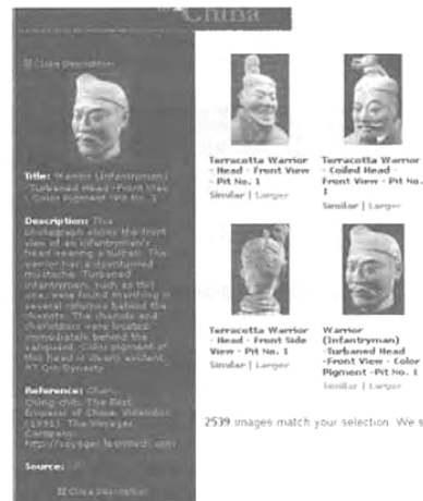
図7 (右) 特定のイメージを選択して「Info」をクリックすると、イメージの注釈文が左のパネルに表示される。

範囲が拡大された。図8に示したように、ナノ粒子化学技術による貴重なイタリア絵画の修復前と修復後のイメージ画像を収録した「Project Restore(修復プロジェクト) 13) 」におけるイタリアのフーレンス大学との興味深い共同事業がスタートしている。また、図3で示したように、他の多くの国や主題についての共同コレクションが開始されつつある。これらに加えて、米国議会図書館のアジア部門との共同事業が進展している。最近、GMNetに米国議会図書館の納漢(のうけい)(ナーシー:中国