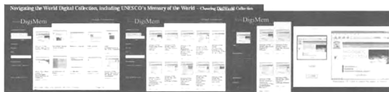
図10 ユネスコの「世界の記憶」サイトのイメージ情報を瞬時に検索・リンクできる（黄色で表示）