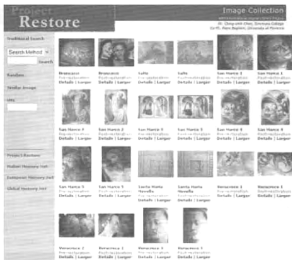
図8 フローレンス大学からのProject Restoreの修復以前と以後のイメージ画像