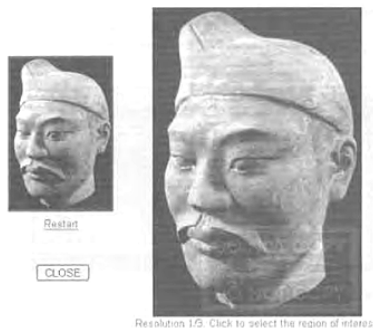
図6 (上) 複数回拡大したイメージの表示