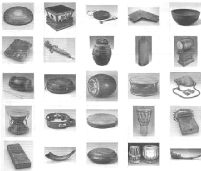
図12 世界の道具（多くはドラム）の例

あらゆるタイプの解像度に対応した、文化的にも重要で、多くの説明文が付与されている中国の素焼きの武人像と馬についての「始皇帝プロジェクト」の多くのイメージコレクションを使用する研究がある。オントロジー（意味論）に基づくイメージ検索やコンピュータ学習機能に基づくイメージ検索などに加えるには困難ではあるが、検索目的に対応した部分イメージ検索を開発したいと考えている。また、知的財産（IP）保護技術を進展させたいと希望している。