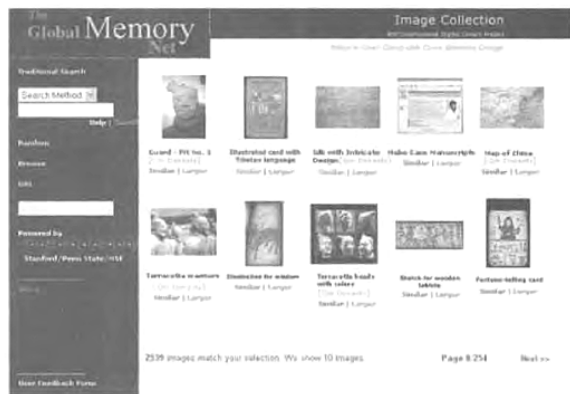
図4 利用者がブラウズや選択するためのランダムイメージ

しかし、多くのケースで、GMNetでどのようなイメージが見られるのかわからないであろう。図書館のように、蓄積しているイメージを閲覧できるような機会を利用者に提供し、利用者の要求や要望を把握できるようにする必要がある。GMNetではスタンフォード大学が米国科学財団のデジタルライブラリー(DL)1フェーズで開発し、ペンシルバニア州立大学がNSF/TTRの資金で発展させた、SIMPLIcityというコンテンツベースのイメージ検索技術を導入し、イメージのランダム検索機能を強化している(引用文献10を参照)。この技術は、利用者に数千のデジタルイメージを正確で効果的に、瞬時にブラウズし、検索し、楽しみ、学習できるようにする。