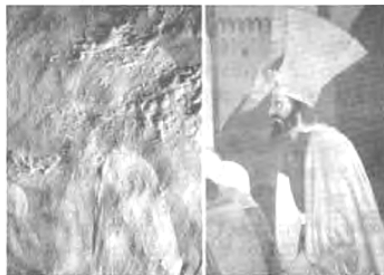
図1 ダメージを受けたイタリアの文化遺産の修復以前と以後のイメージ画像